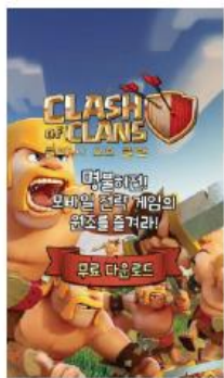
클래시 오브 클랜