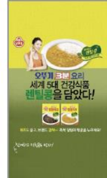
오뚜기 3분 렌틸카레